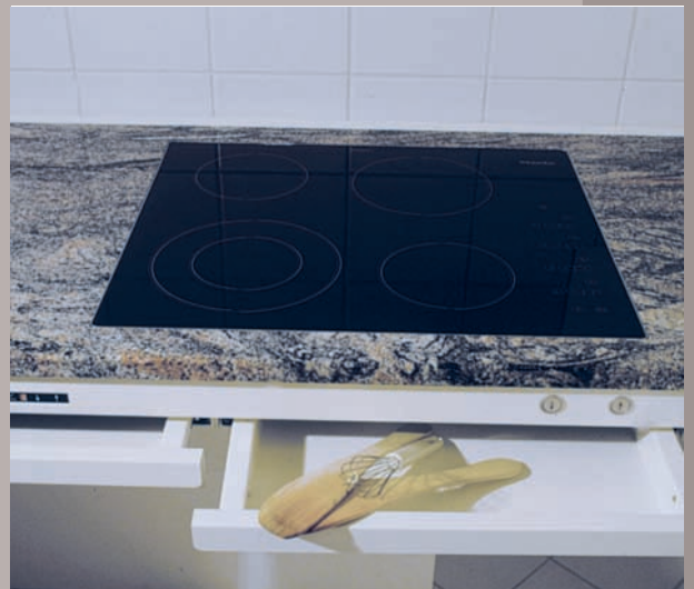
Kochfeld mit Schubladen