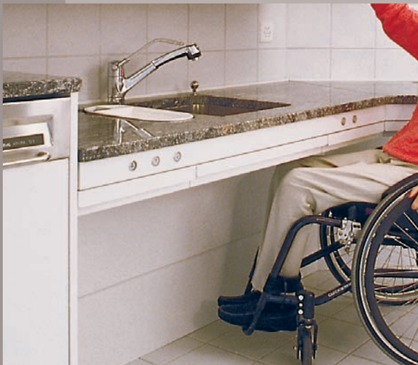
Spültisch höhenverstellbar Modell Muota Wandsäulen