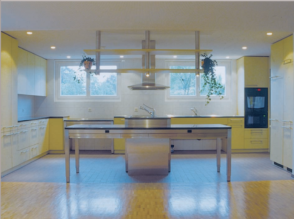
Küche im Wohnheim für Menschen mit körperlicher oder mehrfacher Behinderung