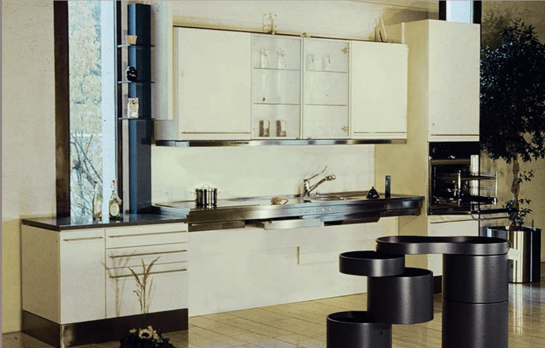
Küche im Privathaushalt mit höhenverstellbarem Koch- / Spültisch und absenkbarem Oberschrank