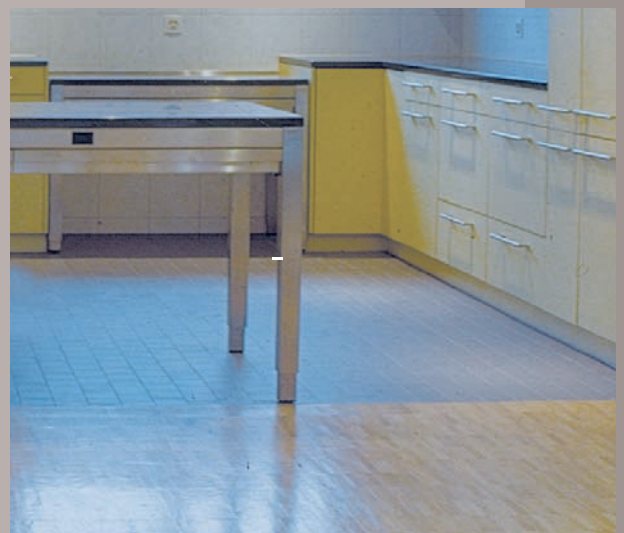
Inseltisch höhenverstellbar Modell Muota 4Fuss