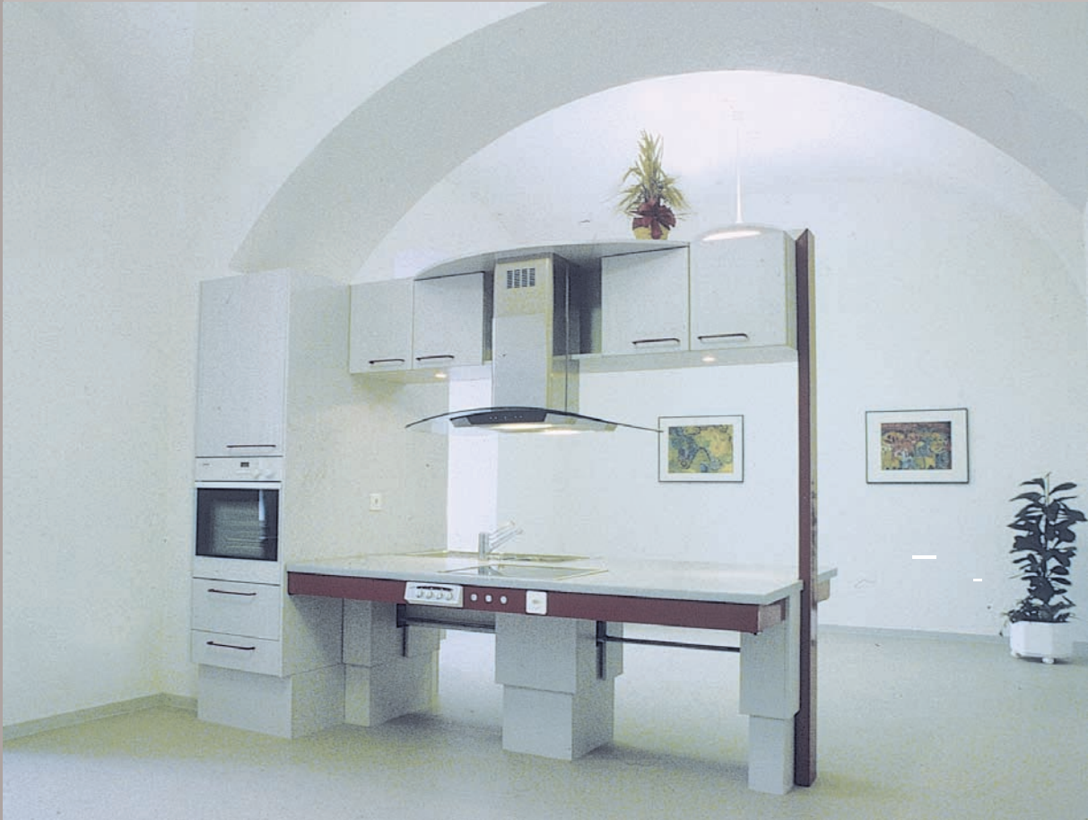
Therapieküche im Pflegeheim Ergotherapie / Aktivierungstherapie